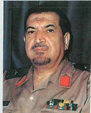
اللواء الركن /

وقد استقى المؤلف مادة كتابه من مصادر ومراجع قيمة وكثيرة تؤكد للقاريء أنها